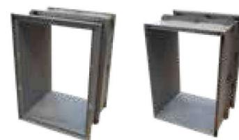
Ansicht zum Verbau mit Blendrahmen